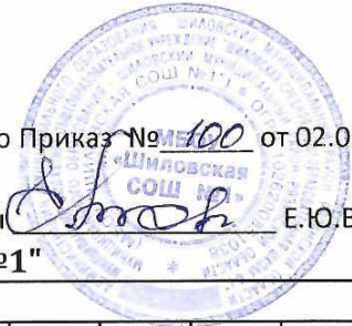
График проведения оценочных процедур в МБОУ "Шиловская СОШ №1"